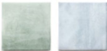
AG-15 / アクアマリーナ AG-29 / アズーロ