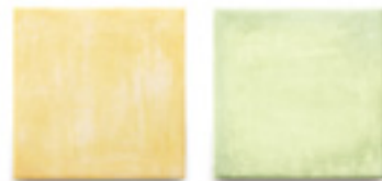
AG-13 / ジャッロ AG-14 / ヴェルデ