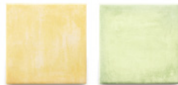
AG-13 / ジャッロ AG-14 / ヴェルデ