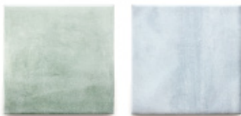
AG-15 / アクアマリーナ AG-29 / アズーロ